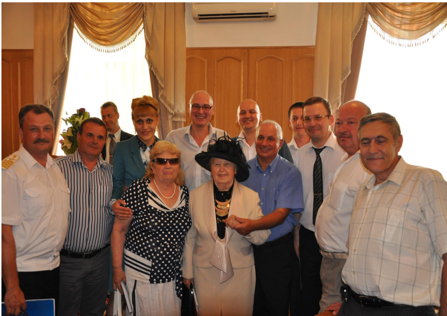
Зустріч з академіком В.О. Коноваловою на засіданні Спеціалізованої Вченої ради (НАВС, 2013 рік)