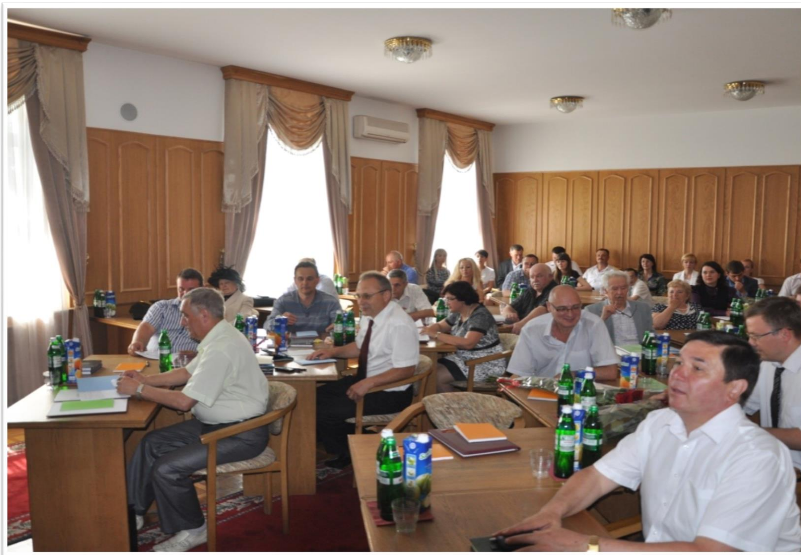
Засідання Спеціалізованої Вченої ради з захисту дисертацій (НАВС, 2011 рік)